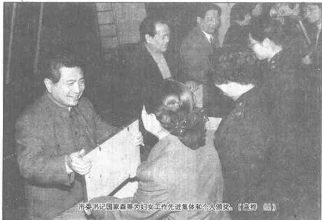
市委书记国家森等为妇女工作先进集体和个人颁奖。

本报讯 3月4日，我市庆“三八”暨妇女发展经济表彰大会在东营宾馆召开。市和军分区领导国家森、姜振邦、贾其贤、张秀香、刘存吉、李续等出席会议。